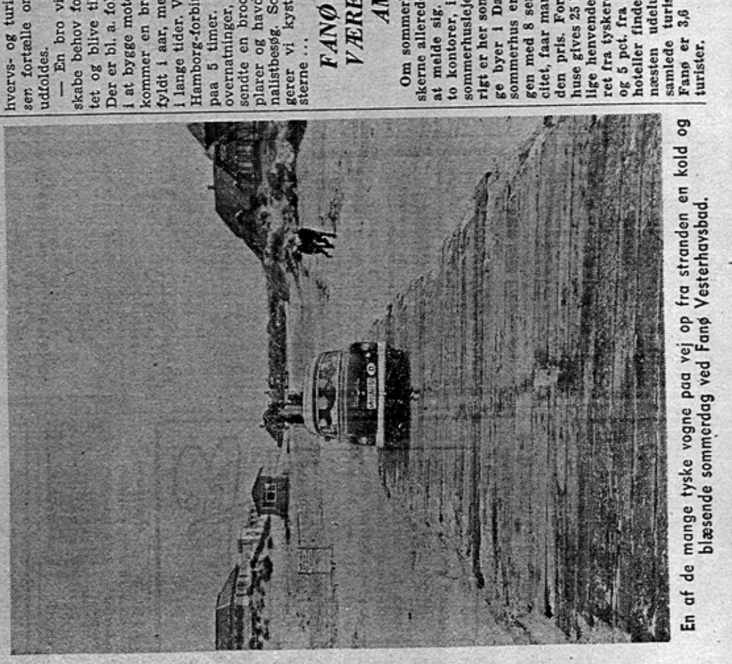
En af de mange tyske vogne paa vej op fra stranden en kold og blæsende sommerdag ved Fanø Vesterhavsbad.

Der er to faktorer, der giver bro-byggerne stærk medvind. Fanøboerne er blevet utrolig daar-ligt behandlet med hensyn til tra-fikmidler. Denne baggrund har sik-ret broen mange stemmer paa øen.