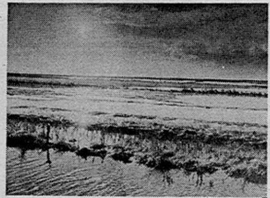
- Vi skal sikre Vadehavet så også kommende generationer har mulighed for at opleve dette storstuede naturområde, siger Svend Tougaard.

havet af så stor betydning for fugle og sæler, at det kræver en høj grad af beskyttelse, der indebærer en nøje planlægning af både den erhvervsmæssige og rekreative udnyttelse.