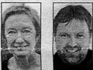
AF TOVE BAK (tekst)

Miljøministeren vil blive mødt af mange ønsker om ændring af reglerne for Vadehavet. Mange foreninger og organisationer kan bidrage til ønskelisten, der garanteret bliver lang.