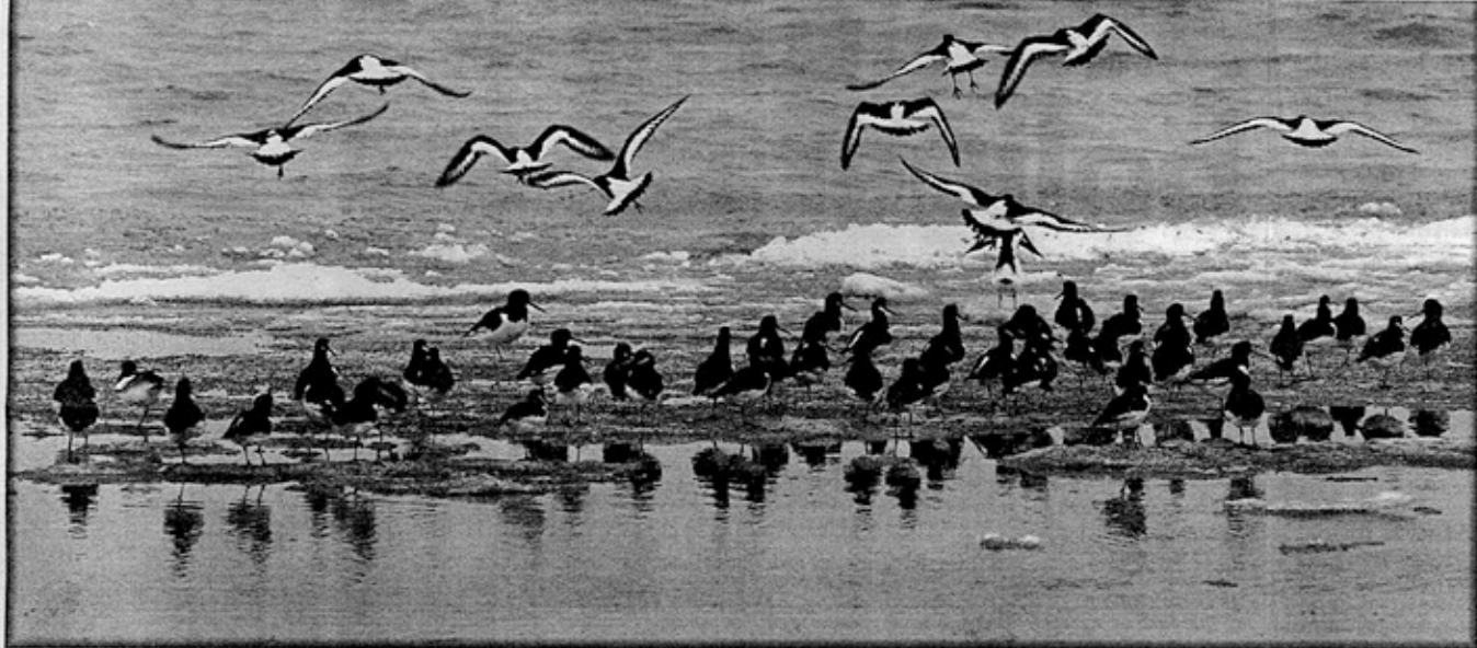
De mange fredningsbestemmelser i Ho Bugt og Vadehavet tager primært sigte på at værne om de mange fugle i området.