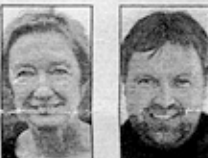
AF TOVE BAK (tekst) og H.C. GABELGAARD (foto)

Miljøministeren vil blive mødt af mange ønsker om ændring af reglerne for Vadehavet. Mange foreninger og organisationer kan bidrage til ønskelisten, der garanteret bliver lang.