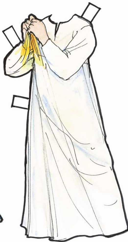
Pige i undertøj Særk i hørlærred med slids og lange ærmer