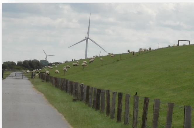
Får på dige ved Vadehavet