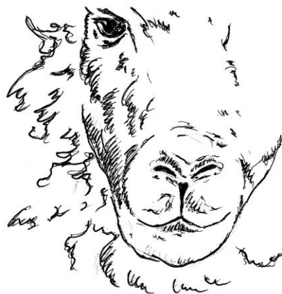
Mule med spaltet overlæbe

Fårene har fire klove på hvert ben, hvor de to er små bi-klove. Bi-klovene sidder et lille stykke oppe bag på hvert ben. Bi-klovene hjælper fåret, så det ikke synker ned, hvor der er blødt underlag.