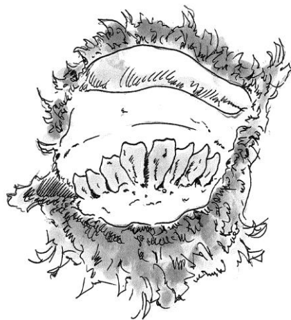
Tænder og brusklade