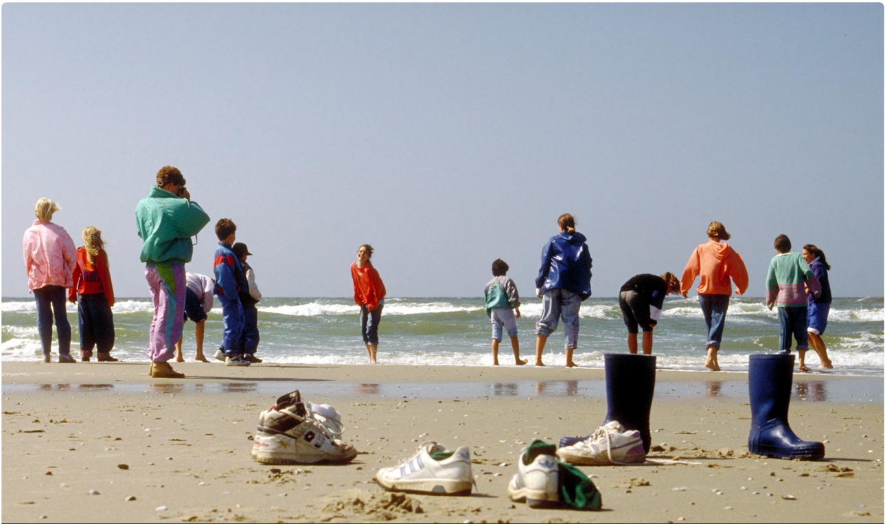
I Holland har man valgt at grænsen går bag om vadehavsøerne, så det er ikke verdensarv disse gæster stikker fødderne på Texel.

er der plads til at dyrearterne kan finde flere levesteder i området eller - over tid - at finde deres helt egen niche at udnytte. Vadehavets rigdom og mangfoldighed af arter gør området til et vigtigt raste- og yngleområde for 10-12 mio trækfugle hvert år, hvoraf flere er omfattet af Ramsar konventionen.