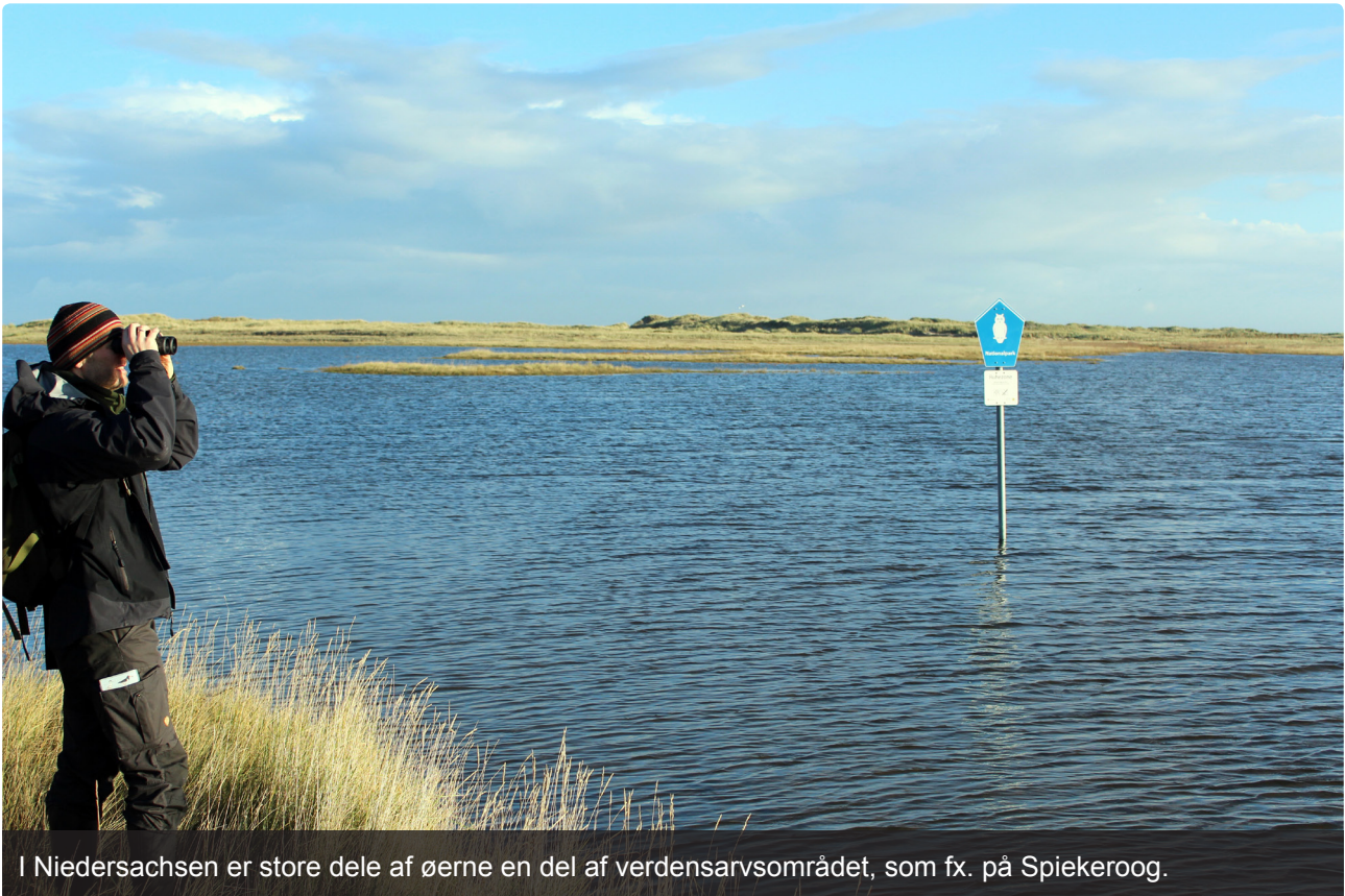
I Niedersachsen er store dele af øerne en del af verdensarvsområdet, som fx. på Spiekeroog.