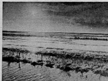
- Vi skal sikre Vadehavet så også kommende generationer har mulighed for at opleve dette storslåede naturområde, siger Svend Tougaard.

havet af så stor betydning for fugle og sæler, at det kræver en høj grad af beskyttelse, der indebærer en nøje planlægning af både den erhvervs- og rekreative udnyttelse.