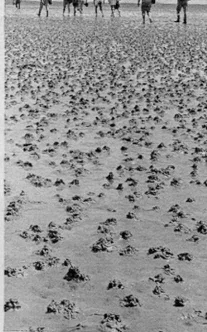
Vadehavet strækker sig fra Ho bugt og 500 km syd pd.